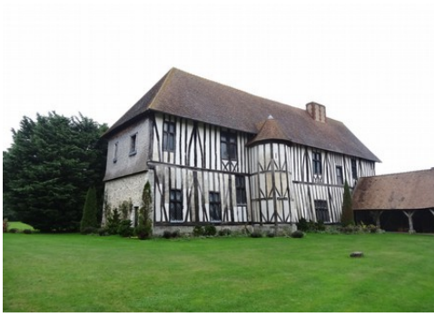
La façade sud du manoir