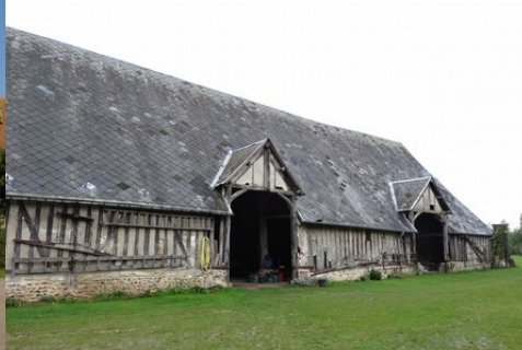
La grange à pans de bois et toiture haute