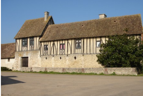
Le bâtiment d'entrée depuis la rue