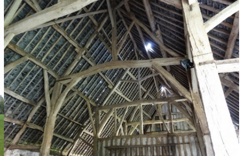
La charpente de la grange

Pour la zone en rose foncé dans le périmètre de 500m