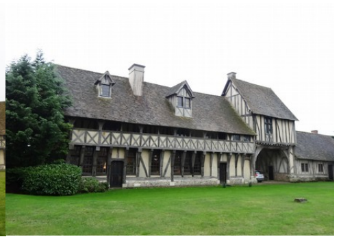
Le bâtiment d'entrée avec sa galerie