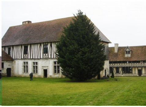
Le manoir vu du Nord